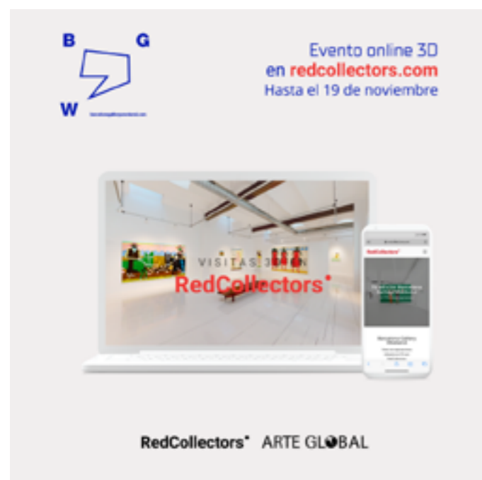
#BGWbyRedCollectors Exposicions a les galeries participants en 3D i assessoria en línia personalitzada per a la compra d'obres AQUÍ .