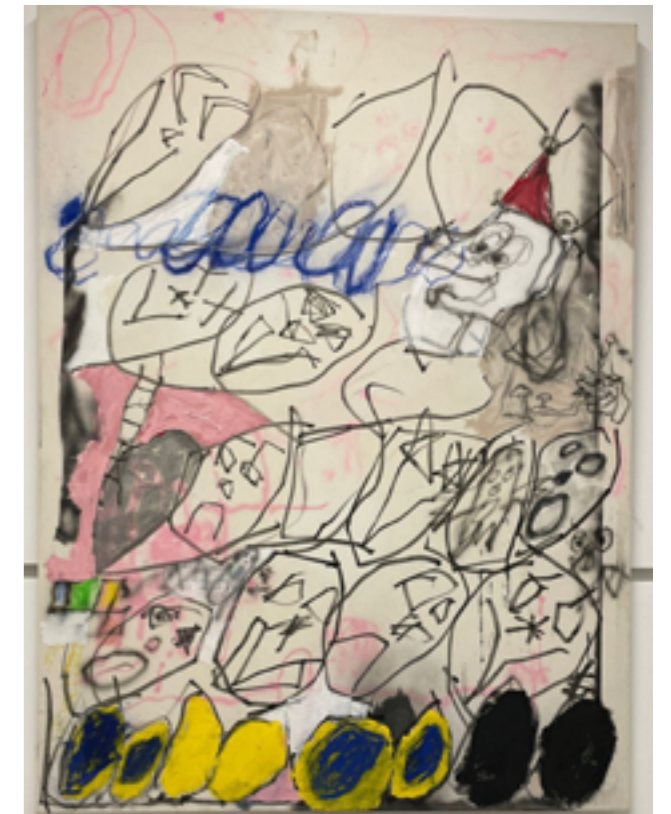
COLECCIÓN MANUEL EXPÓSITO - VisualSign 3 Punts Galeria Marria Pratts: All Wizards Make Mistakes, 2020 Tècnica mixta sobre tela 120 x 80 cm