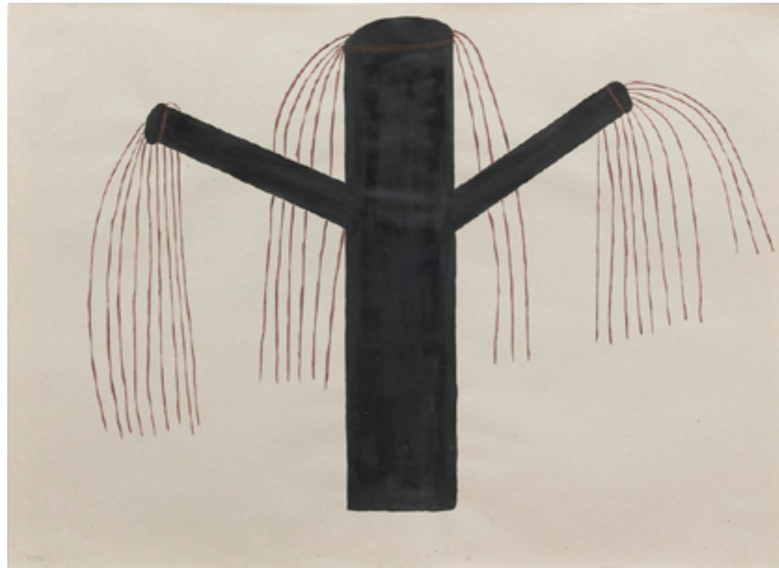
PIRAMIDÓN, CENTRE D'ART CONTEMPORANI Galeria Ana Mas Projects Sheroanawe Hakihiiwe: Masi | Especie de palma de frutos duros, 2019 Acrílic sobre paper de canya estucat 50 x 70 cm