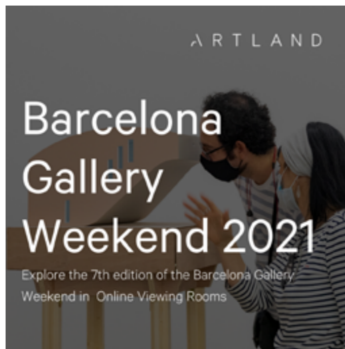
BGW x Artland Viewing rooms AQUÍ