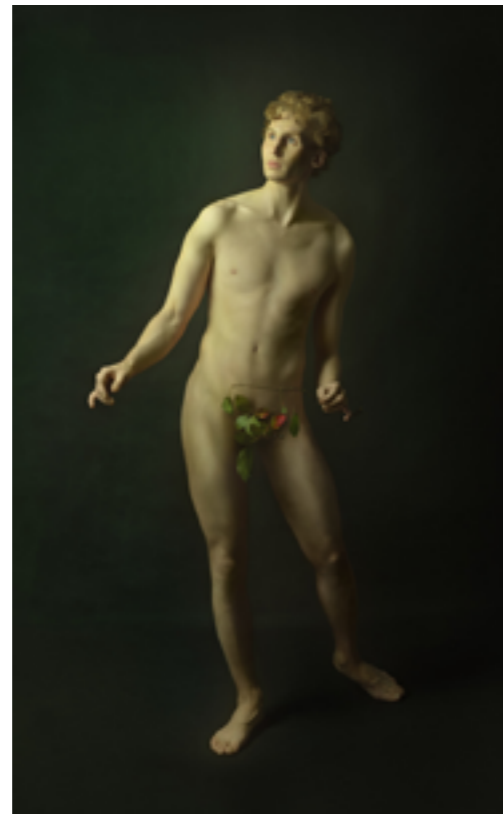
FUNDACIÓ VILA CASAS Galeria Valid Foto Alisa Sibirskaya: Adán y Eva, 2019 (Serie Génesis) Impressió en Chromaluxe, Ed. 1 /3 120 x 80 cm